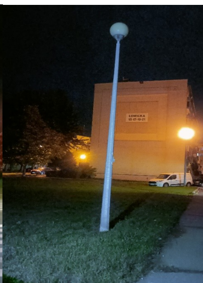
Lampy Nr 1 – 2 ul. Sikorskiego