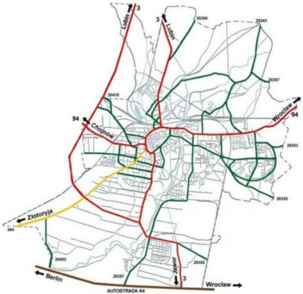
Rysunek graficzny (mapa) - granice miasta Legnicy.