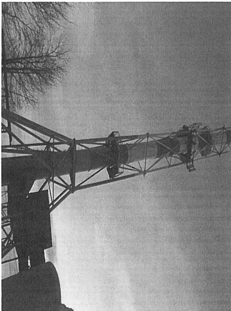
Zal. nr 1: Widok ogólny instalacji radiokomunikacyjnej.