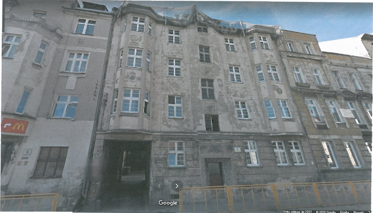
Załącznik 1. Widok od frontu budynku przy ul. Kartuskiej 3 w Legnicy.